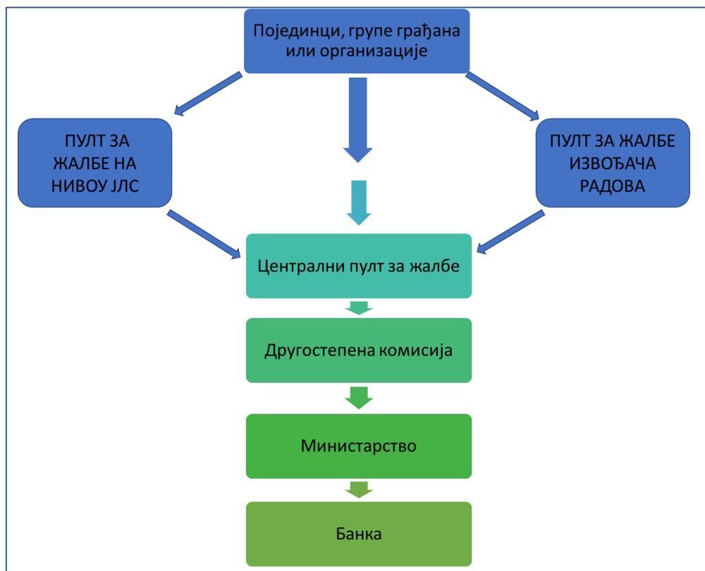
Слика 1. Шема функционисања жалбеног механизма

доноси Другостепена комисија образована решењем министра грађевинарства, саобраћаја и инфраструктуре. Организација ЖМ-а је представљена на слици 1 овог документа.