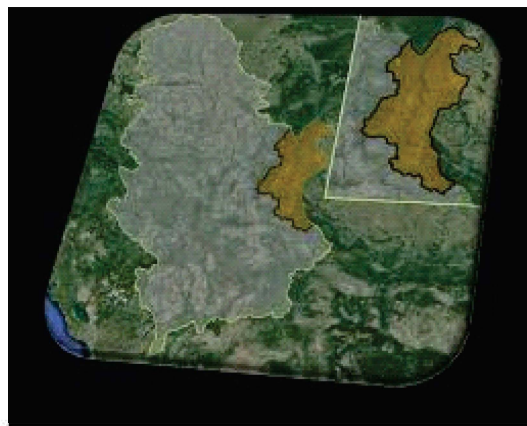
Слика. 1. – Карта Кладова

Општина Кладово је најмања општина не само у Борском округу већ и у целој Тимочкој крајини. Површином од 629 км 2 захвата област Кључ, која је тако названа по великом Дунавском меандру, као и делове Ђердапске клисуре (Пецка бара - Давидовац) и Неготинске крајине (Слатинска река - Милутиновац).