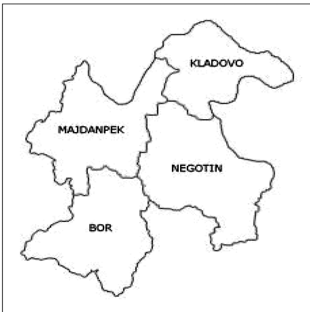
Слика 2. - Приказ положаја општине Кладово у оквиру Борског управног округа

Административно, привредно и културно средиште општине је град Кладово. Кладово се убраја у старије градове у Подунављу, а настанак насеља се везује за војно цивилни логор који су подигли римљани на граници, познат под именом Занес. Када је логор разорен, Словени су на његовим темељима подигли своје насеље Нови Град чији остаци се налазе непосредно пре уласка у савремени град идући Ђердапском магистралом у правцу од Доњег Милановца ка Кладову. На том месту Турци су, за време владавине Махмуда II у XVI веку, изградили тврђаву Фетислам из две целине, Мали и Велики град, чиме је Нови Град изгубио словенски карактер.