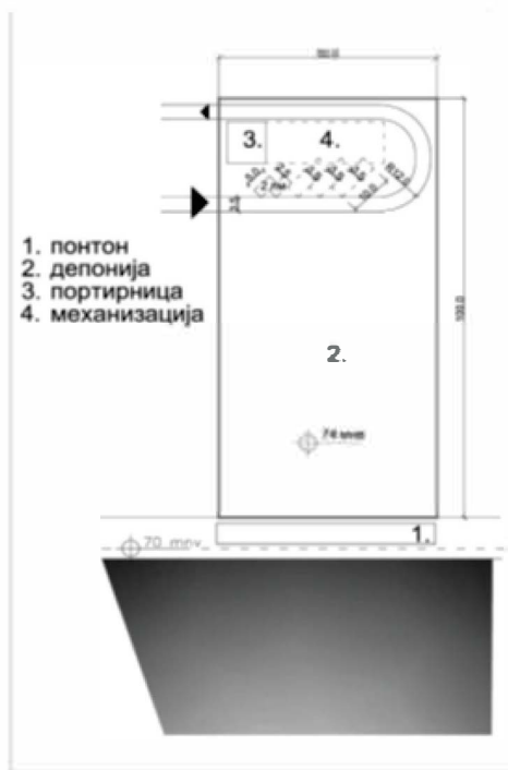
Слика 1: Шематски приказ депоније речног материјала - типа А Кладушница, Кладово-кота 38,60 мнв. ен 33,60.

Површина комплекса за депоновање речног материјала типа А је 0,5 – 1,0 ха.