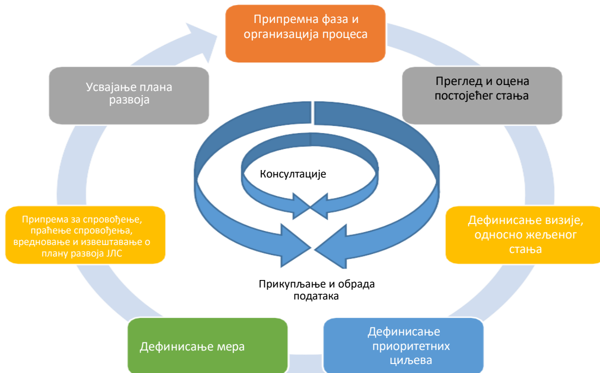
Слика 1. Фазе израде Плана развоја