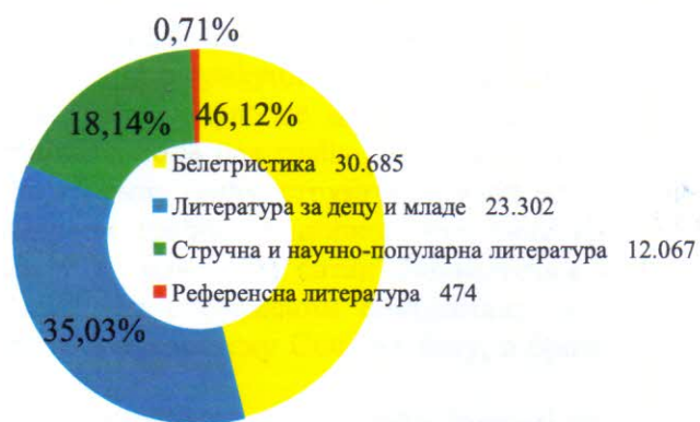
Графикон бр. 1